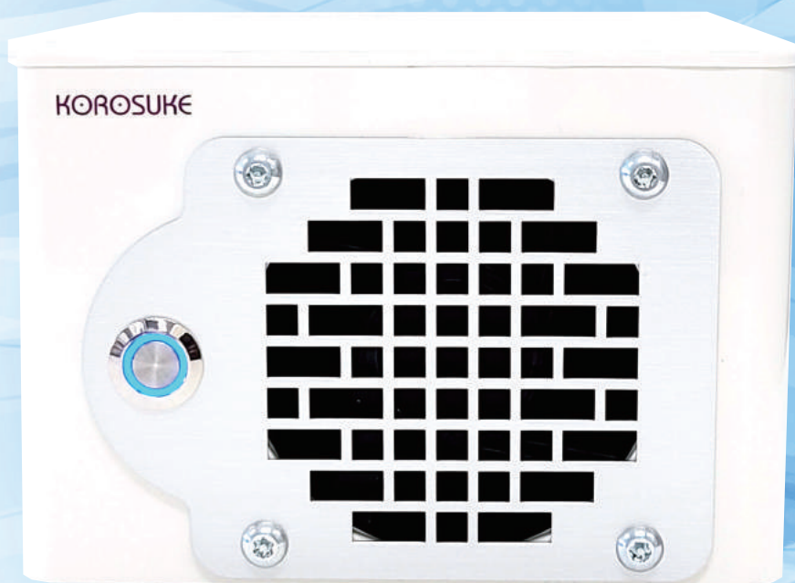
紫外線LED空気清浄機 実用新案登録済